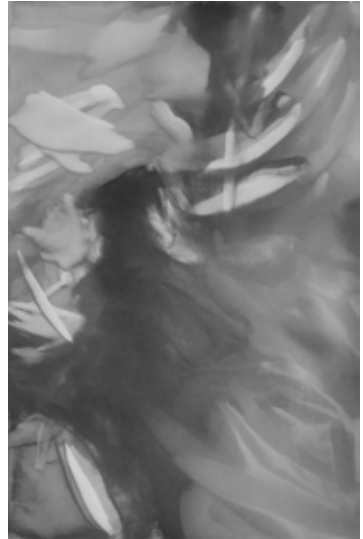
Silhouettes Fragmentées 3 - 2014 - 60x91.5 cm

« Il existe dans le 93 les MAV (Marabout Army Volunteers) et le ghetto « Fabulous Gang ». Ces groupes parlent avec un pouvoir magique et ensorcelant, composé de leurs inspirations personnelles et de leurs connaissances de la troisième dimension d'aujourd'hui.