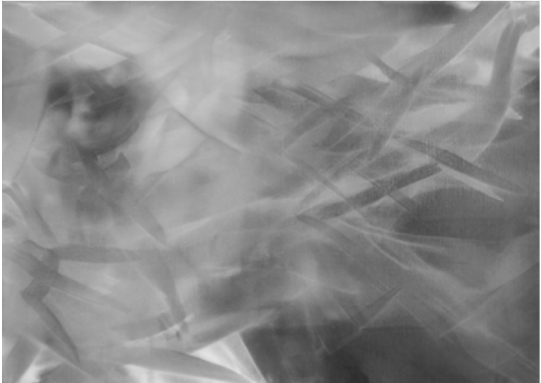
Silhouettes 11 - 2015 - 65x92 cm

«En les peignant, je redonne de l'anonymat aux personnes photographiées, je n'exploite plus leur image.»